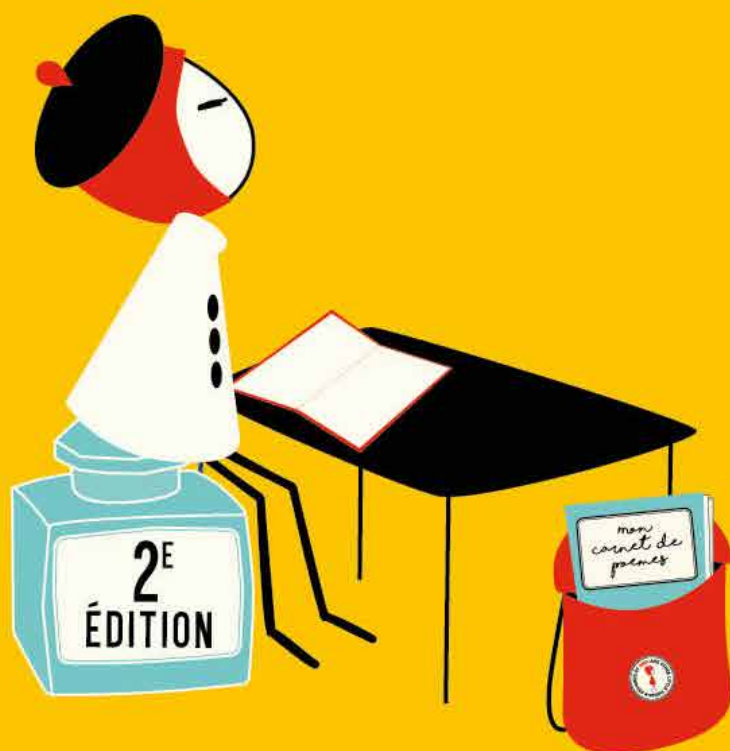
Illustration de ©2017 NINA AND OTHER LITTLE THINGS® | Licensed by DDC