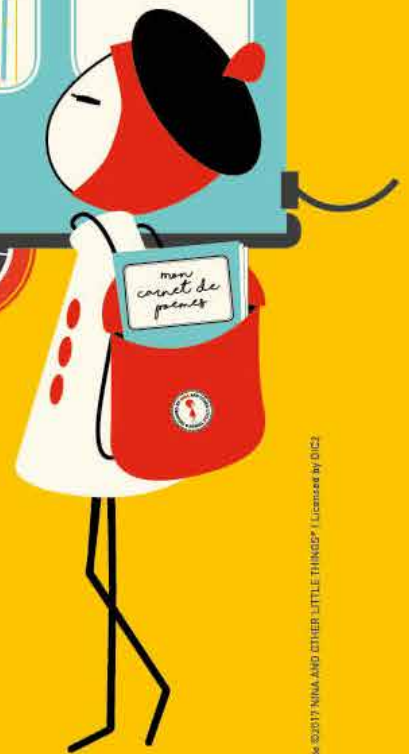
Illustration de ©2017 NINA AND OTHER LITTLE THINGS / Licenced by DICZ